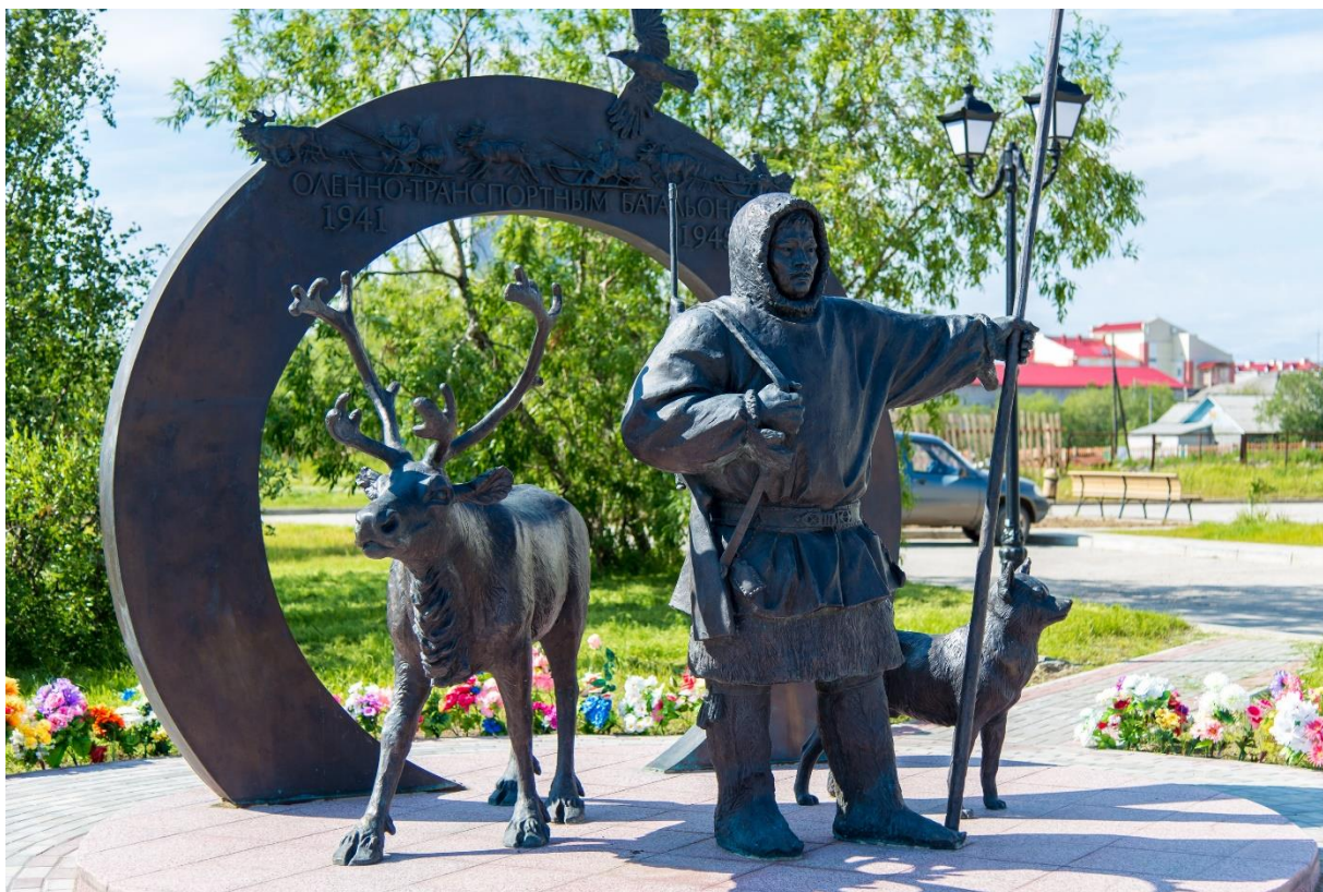
Памятник Участникам локальных войн и вооруженных конфликтов